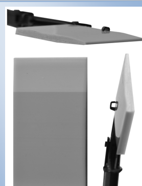
Abb. 2 Keil 6.3 mm und 8.5 mm